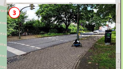
3 Bitte die Ampel zur Querung nutzen!