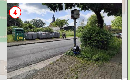
4 Unübersichtlich! Bitte hier nicht die Fahrbahn überqueren! Ampel nutzen!