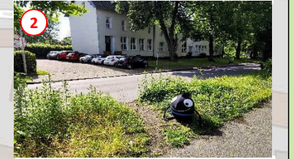
2 Gefährlich! An dieser Stelle unter keinen Umständen die Straße queren, bitte Ampel nutzen.