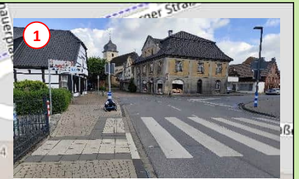
1 Unübersichtlich! Bitte über den Zebrastreifen die Straße queren.